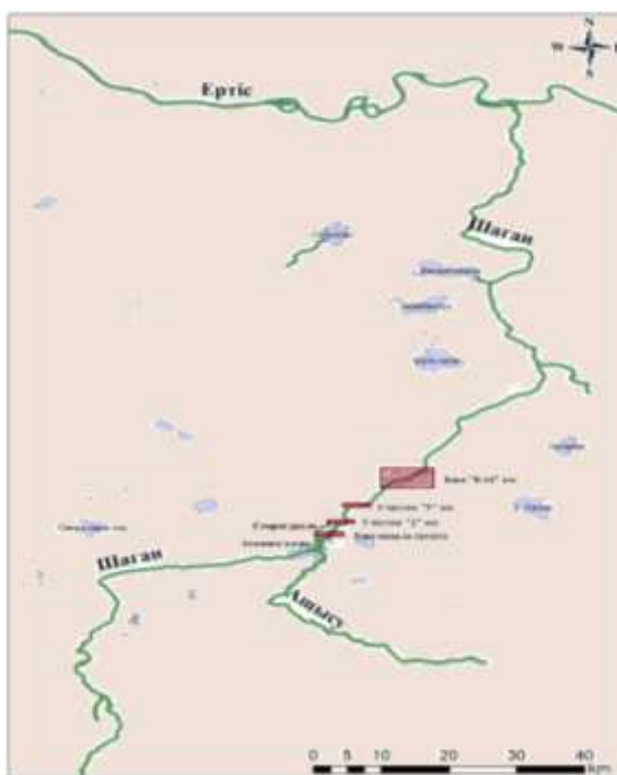
Рисунок 1. Основные участки загрязнения вод р. Шаган

В частности, в работе [7] были выделены зоны с аномально высоким уровнем радиоактивности. К ним относятся район разгрузки загрязненных подрусловых и трещинных вод на поверхностные воды реки (участок на 5-м км); отрезок между 8 и 14 км, где трещинные воды поступают в грунтовые воды поймы р. Шаган и далее разгружаются в поверхностный водоток, а также сегмент «старого» русла с водопроявлениями из зоны навалов «Атомное озеро» также с разгрузкой загрязненных подрусловых и трещинных вод на поверхностные воды реки (рисунок 1).